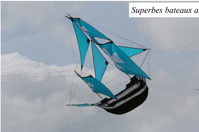
Superbes bateaux allemands, c'est long à monter mais cela vole bien.