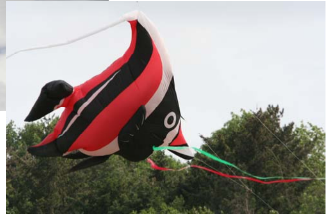
Des statiques pas si statiques que cela à cause des turbulences. Si si, ils étaient là aussi, mais je parlais du vent.