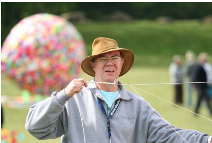
Des fidèles de brie.