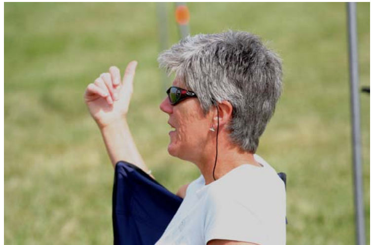
Même pas une fois...