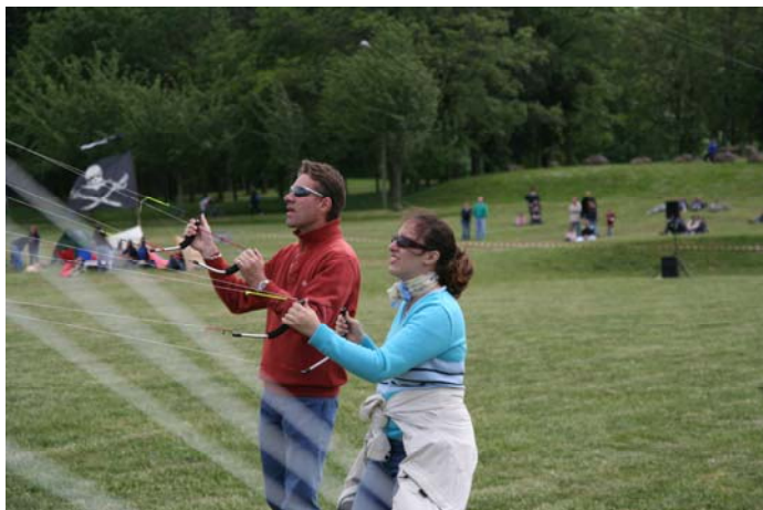
Les 4 lignes en nombre sur le terrain.