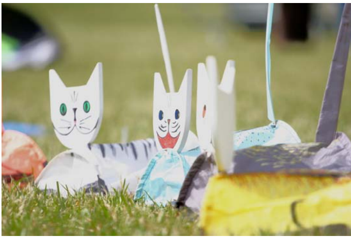
Miouuuuu ! Il va taper sur ses doigts !